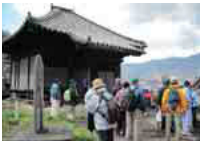
5番札所西浦観音堂