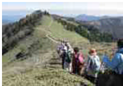
一ノ森へ爽快尾根歩き