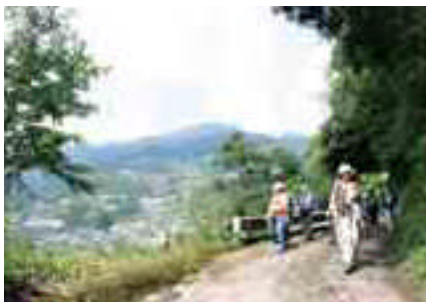
一宇山間集落の眺め

いろは巨樹めぐりハイキング 参加料 2,500円(昼食料、保険料込み) ※小学生1,300円、未就学児童は参加できません。