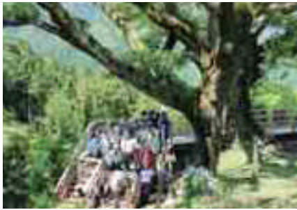
日本一の赤羽根大師のエノキ

巨樹めぐり“巨樹王国”一宇 参加料 おとな6,500円 こども6,000円(昼食料・入浴料込み)