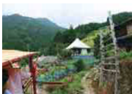
集落のシンボル十家お堂

参加料 1,000円 (保険料込み) ※小学生以下は無料、未就学児童は参加できません。