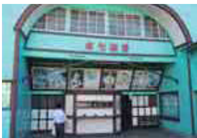
昭和7年開業 貞光劇場