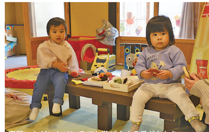
寄贈いただいたベンチでお遊びをする子どもたち

1月17日、つるぎ高校から貞光二層うだつの町並みにある子育てひろば「あんりーる」に木製の子ども用ベンチを寄贈いただきました。大きさは、幅1メートル10センチで幼児が3人ほど座ることができます。