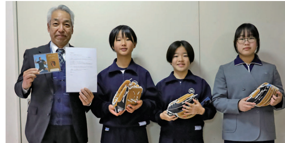
▲貞光小学校は朝礼でグローブが届いたことを全校児童に伝えました。