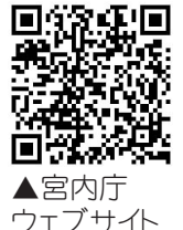
▲宮内庁ウェブサイト

法テラスでは法的トラブルでお悩みの方々に、法制度に関する情報と相談窓口に関する情報を無料で提供しています。