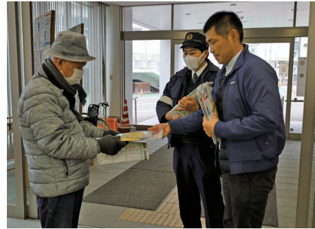
啓発グッズを配布する様子