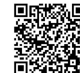
▲国家公務員試験採用情報NAVI