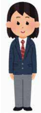
20代 トランスジェンダー FTM

性別違和を感じたのは物心ついたときから。 そこから自分が心の性は男性であることに気付くまで時間がかかった。 20歳の時に、同じ大学の子(FTM)がきっかけでようやく本当の自分に気付いた。それまでは、なんとなく周りに気を遣いながら、自分の性別違和のことを隠していた。 本当の自分に気付くには、情報ときっかけがないと難しい。 「性同一性障がい」という言葉は知っていても、なかなか自分のことだと認められない。世間体や人目を気にしてしまうから。 でも、今は不思議なことに、友達や職場、そして身内にまで、自分の身の回りの人にFTMのことをかなりオープンに話せるようになってきた。 おかげで今は自分らしい生き方を家でも職場でもできている。