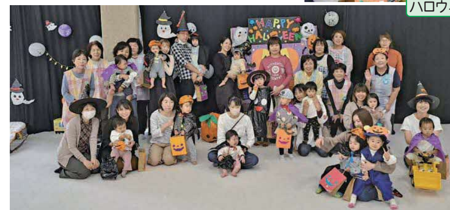
ハロウィンを楽しもう