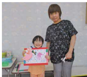
▲手形アートを作ろう▲

月2回、季節に合わせた楽しい催しを計画して、みなさんを待っています。子育てって楽しい時もあれば大変な時もありますよね。気軽に遊びに来て、悩みがあれば1人で抱えこまずに相談してくださいね。