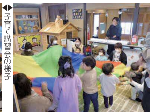
◆子育て講習会の様子