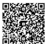
「国税庁動画チャンネル」へのアクセスはこちら!