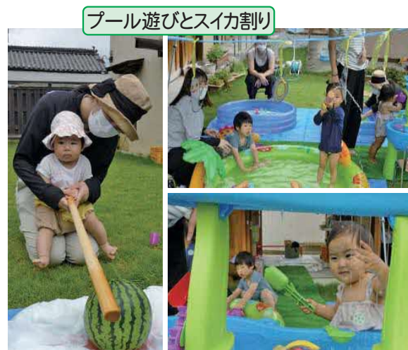
プール遊びとスイカ割り