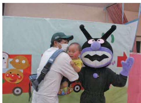
▲夏祭りに参加しよう▲