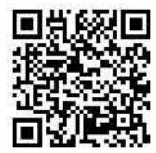
チャットボット「ふたば」のご相談はこちら!

質問したいことをメニューから選択するか、自由に文字で入力いただくとAIが自動回答します。