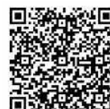
マイナポータル連携の詳細についてはこちら!