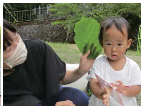
▲ネイチャーゲームで遊ぼう

月2回、季節に合わせた楽しい催しを計画して、みなさんを待っています。子育てって楽しい時もあれば大変な時もありますよね。気軽に遊びに来て、悩みがあれば1人で抱えこまずに相談してくださいね。