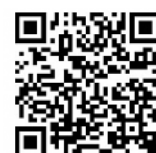
確定申告書等作成コーナーはこちら!

※3 マイナポータル連携により控除証明書などのデータを取得するには、控除証明書の発行主体が、マイナポータル連携に対応していることが必要です。