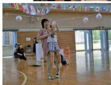
▲なかよしうんどうかい▲