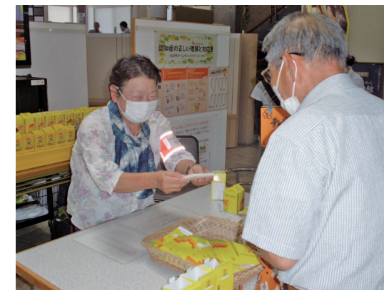
募金協力者に啓発用ポケットティッシュを渡す様子