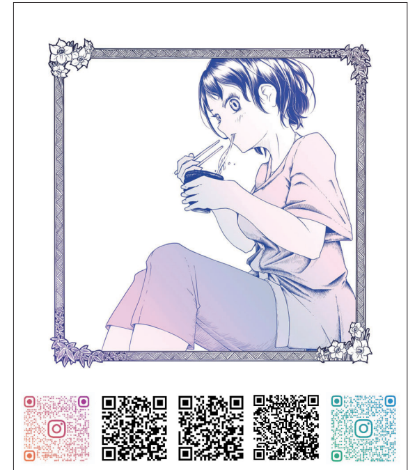
渋谷地下街に掲示するポスター

い、交流人口や関係人口を増やすことを目的に、「つるぎ町情報発信事業」として渋谷地下街に掲示するポスター作成に活用させていただきます。