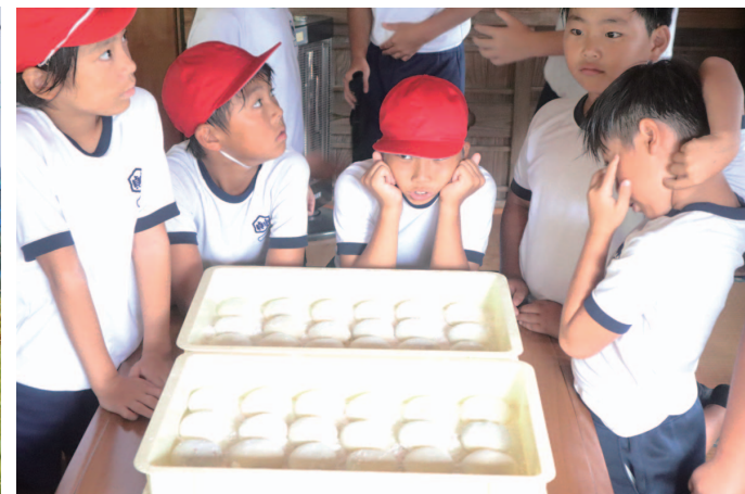
▲「こきび」を使用した雑穀餅

編集・発行 つるぎ町まちづくり戦略課 ☎ 0883・62・3111 ㊟ 0883・62・4944 〒779-4195 徳島県美馬郡つるぎ町貞光字東浦1-3