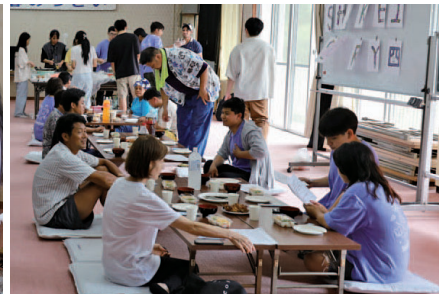
▲食卓を囲みつつ、つるぎ町での生活や留学生のこれからの進路などを語り合い交流を深めていました。