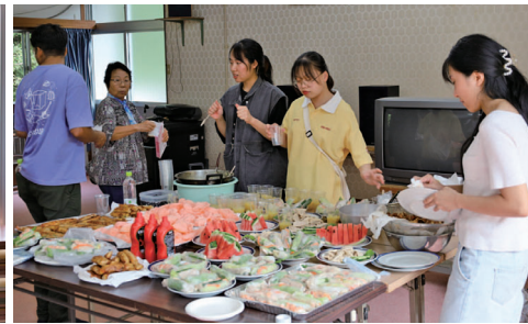
▲交流会はビュッフェ形式で行われました。