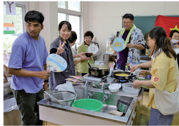
▲団扇で扇ぎ合いながら調理を行いました。