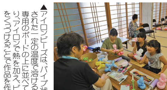
▲バルーンアートでうさぎや花を作りました。

▲アイロンビーズはパイプ状にカットされた一定の温度で溶けるビーズを専用のボードの上に並べて絵柄を作り、アイロンで熱を加えビーズ同士をくっつけて作品を作ります。