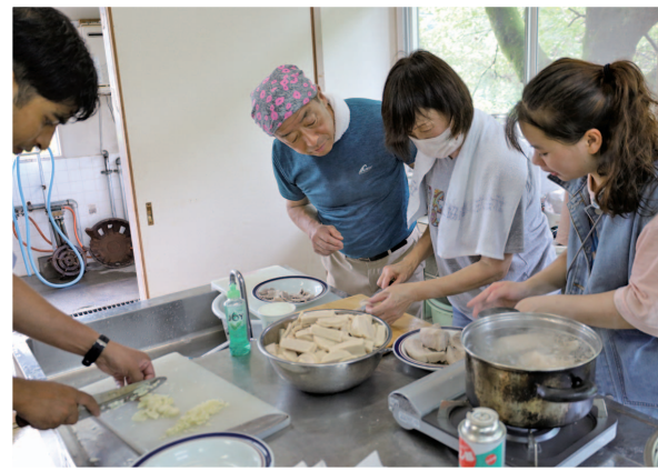
▲湯煎した豚肉を春巻き用の皮で包めるのつるぎに切ります

留学生は「つるぎ町は自然が豊かで、人柄も良く、楽しく課外活動をすることができました。厨房で料理しているときは暑かったけど、おばあちゃんが団扇で扇いでくれて、それが周りに広まって、団扇で扇ぎ合いながら一緒に料理できたことがとてもうれしかった」と話してくれました。参加した地域の方は「初めて外国の方と交流したが、皆さん日本語が上手で、楽しくお話しすることができました。また孫によく似た方がいたので、自然体で交流することができました」と嬉しそうに話していただきました。