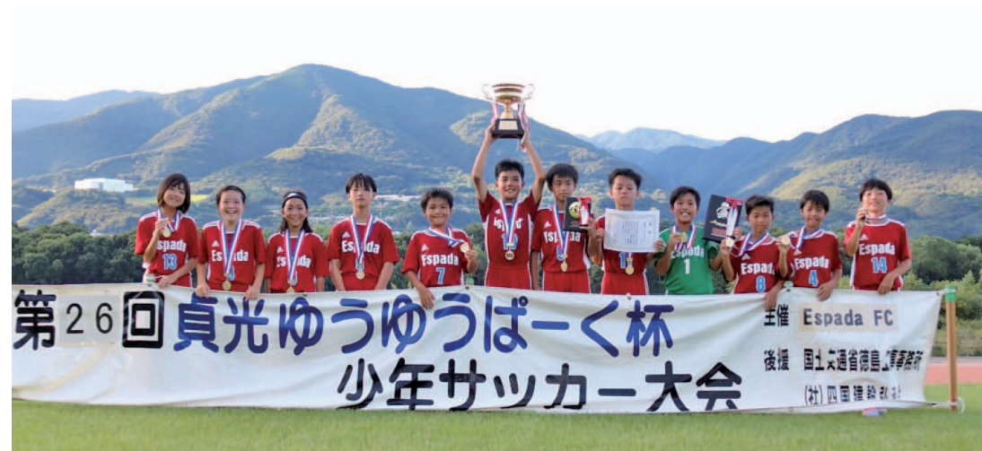
優勝したEspadaFCの選手の写真

EspadaFCは、毎週火、水、金曜日の19:00から貞光中学校で練習を行っています。興味のある方は、お気軽に見学にお越しください。(幼稚園児を対象とした「キッズサッカー教室」も開催しています！)