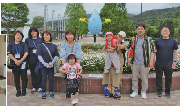
合同親子バス遠足▶

これまでの、活動の一部を紹介します。皆さまの子育てがより楽しくなるお手伝いが出来たらと思っていますので、気軽に遊びに来て下さいね。また、平日開放や子育て相談も行っているの、ぜひ利用して下さいね。