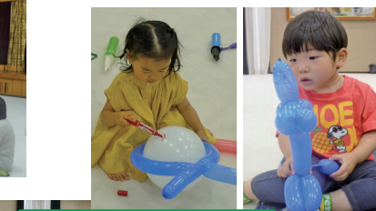
バルーンアートを楽しもう