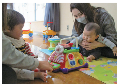
▲顔合わせ～お友だちを知ろう～