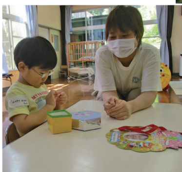
▲廃材を使って楽器を作ろう