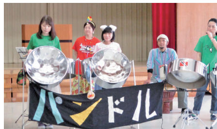
▲スティールパンの音色を楽しもう▲