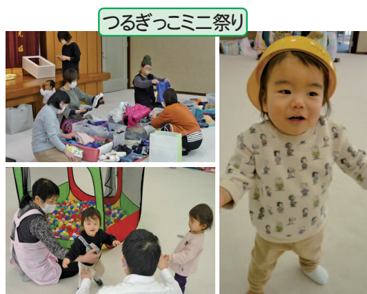
つるぎっこミニ祭り