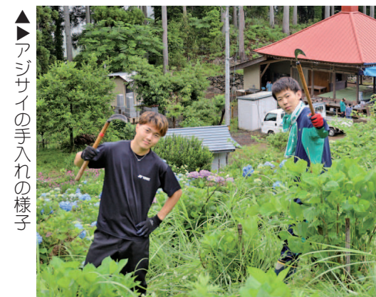
▶アジサイの手入れの様子