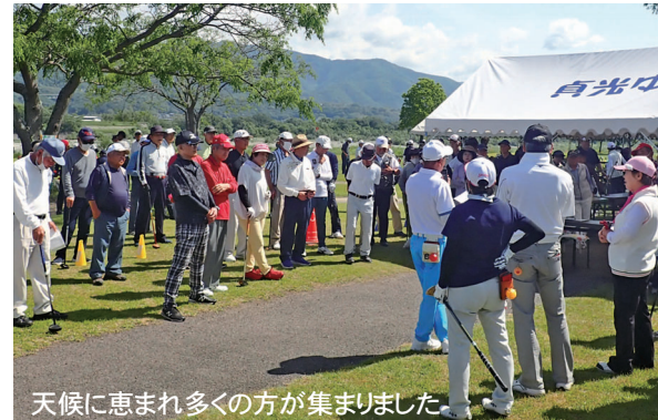
天候に恵まれ多くの方が集まりました