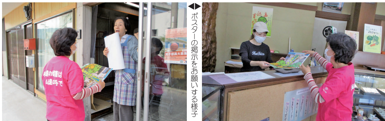
◀ポスターの掲示をお願いする様子

みなさんも私達と一緒につるぎ町の食生活改善推進協議会で健康づくりのボランティア活動をしませんか？