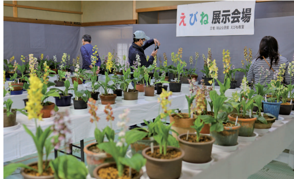
えびね展示会場の様子

4月22・23日、端山公民館でえびね教室主催によるエビネランの展示会が行われ、約300名の来場者で賑わいました。会場にはえびね教室生約20名が丹精込めて育てた、数多くのエビネランや山野草が展示され、会場はほのかに甘い香りで包まれていました。エビネランは山地に自生するラン科の多年草で、色とりどりの花々が来場者の目を楽ませました。教室生の1人は「4年ぶりの開催を待ちに待っていた。多くの人に足を運んでもらい、私たちの作品を見てもらいたい」と話されました。