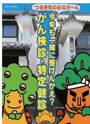
▶がん検診・特定健診の受診勧奨のポスター

町食生活改善推進協議会（ヘルスマイト）では、中央講習で健康づくりや食育について学び、その内容を多くの方に広く知ってもらえるように、各地域で伝達講習の開催や保育所、幼稚園、小・中学校で食育セミナー事業を実施しています。