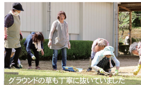
グラウンドの草も丁寧に抜いていました

6月4日、半田の日浦小学校で、日浦をよくする会による環境整備活動が行われました。32名の方が活動に参加し、グラウンド・校舎・体育館・プールなどを清掃しました。同会は日浦小学校が休校になったことなどにより発足した