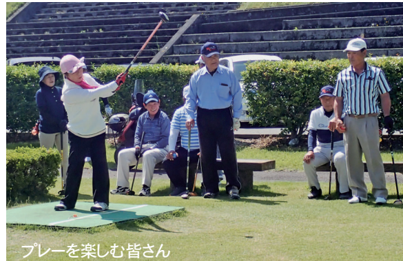
プレーを楽しむ皆さん