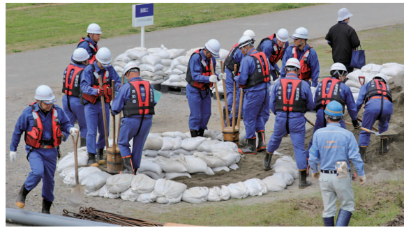
▲美馬西部消防組合消防団による演習

5月28日、西部健康防災公園(三好市三野町)において、「令和5年度 吉野川総合水防演習」が開催されました。この演習は、「水防技術の向上・伝承及び水防団の士気高揚」、「地域社会の防災意識向上」、「災害対処能力の更なる向上」の3つを目的として、国、県、市町、防災機関ならびに吉野川流域にお住いの方々と連携して行われました。本町からは、美馬西部消防組合消防団や自主防災会が、実践的な水防活動に関する訓練に参加しました。毎年のように広域かつ甚大な浸水被害が相次いでいます。この演習を契機に、来るべき水害に備えて、地域防災力の更なる向上を目指して行きます。