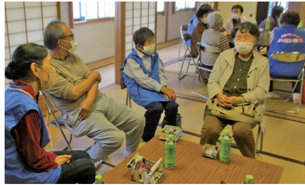
ゆいぐらと全話を楽しくお話し

5月19日、町まちなみ交流館で「よりそいサロン」が4年ぶりに開催されました。このサロンは町内の方ならどなたでも自由に利用できる憩いの場として、「傾聴ボランティアグループよりそい隊♥」が毎月第3金曜日に開催しています。よりそい隊の皆さんは新型コロナウイルス感染症に対する感染予防対策のため、思うように活動ができな中、傾聴ボランティア養成講座の開催やボランティアの仲間づくりをしながらよりそいサロンの再開準備を進めてきました。今回が初めての利用だった方もよりそい隊の皆さんや同じように集まった方々と色々な話に花を咲かせ、新しい出会いと久しぶりの再会を喜びながら、穏やかな時間を過ごされていました。