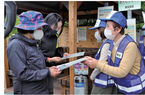
登山客に登山事故防止キャンペーンのチラシを渡す様子

登山シーズン到来です。安心して楽しむために、登山計画をしっかりと立て登山届を提出しましょう。