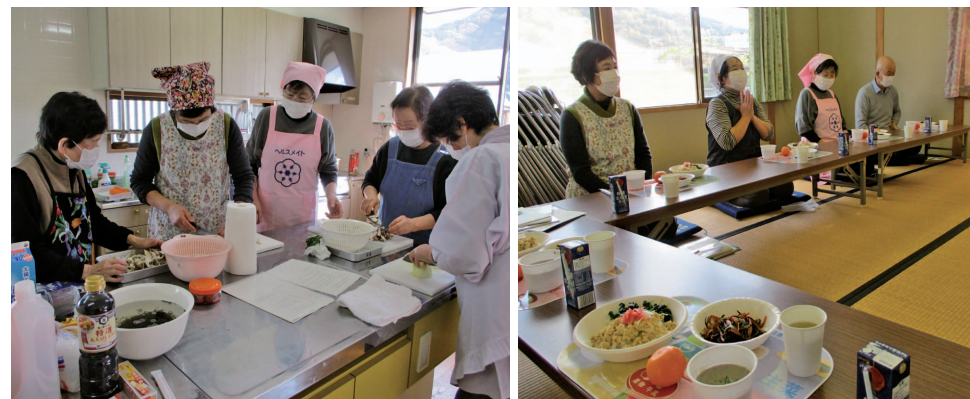
▲昨年、北新町で実施した『シニア・カフェ』 共食の楽しさを実感しました▲

つるぎ町食育推進計画(第3次)のもと、正しい食の知識や食事を選択する力を養うよう学校、家庭や地域などいろいろな場所で食育の取り組みを実践しましょう。