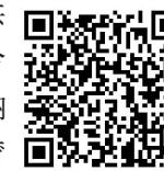
▲地方税お支払サイト

令和5年4月から、軽自動車税(種別割)と固定資産税について、「地方税統一QRコード(地方公共団体が納付書に印刷する全国统一規格の二次元コードのことです)」が納付書に印字してある場合は、ご自宅のパソコンやスマートフォンなどから、クレジットカードや各種スマホ決済アプリなどで納付できるようになります。詳しくは、「地方税お支払サイト( https://www.payment.eltax.lta.go.jp/ )」でご確認ください。