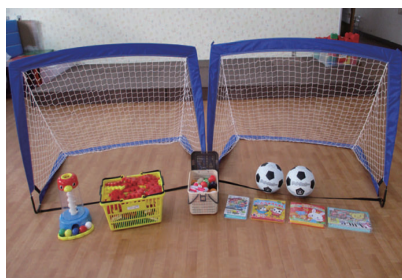
▲寄贈いただいた玩具や絵本など

株式会社成和から貞光保育所に玩具や音の出る絵本などを寄贈いただきました。いただいた用具は、園児の健全な成長のために活用します。