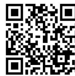
▲徳島県がん検診受診促進プロジェクト動画

※今後の新型コロナウイルス感染症の流行状況によっては、今回ご案内する日程での実施が困難となる可能性があります。