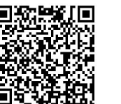
▲にし阿波・糖尿病サポーターについて

にし阿波・糖尿病サポーターについての詳細は、美馬保健所ウェブサイトをご覧ください。