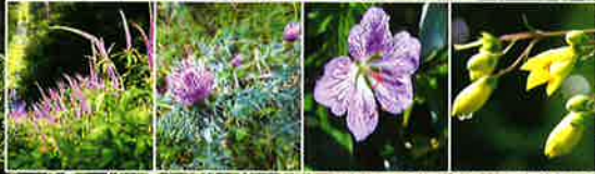
クガイソウ 6月下旬~7月