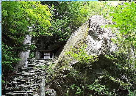
天岩戸神社 奥の院の石窟