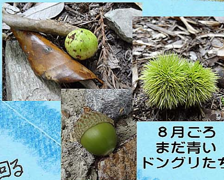
8月ごろ まだ青い どんぐりたち