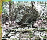
祭祀に使用された のであろうか?

天岩戸を研究されている松山のご夫婦に出く わした。天岩戸神楽が現在は貞光の松尾神社 で舞われていることもご存知で「かつての ように、この一枚岩での神楽舞を見てみ たい」と仰っていた。